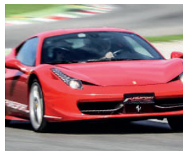
Ferrari 458 ITALIA