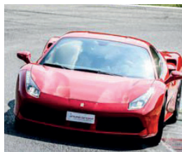
Ferrari 488 GTB